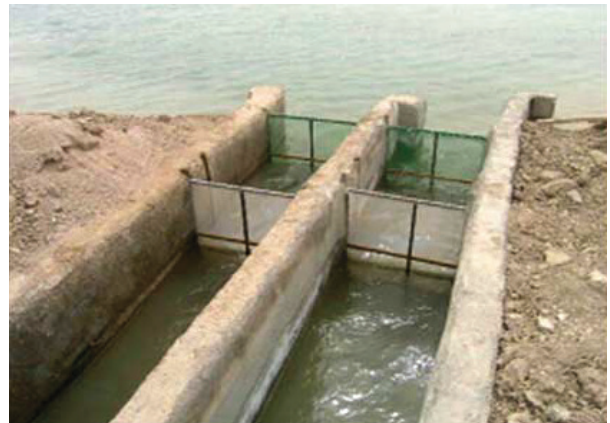
تصویر ۱- استفاده از توری‌های مختلف برای جلوگیری از ورود موجودات ناخواسته.

در ابتدای ورودی سایت پرورش، محلی برای ضدعفونی و ثبت مشخصات خودروهای ورودی تعبیه می‌شود. همچنین حوضچه‌های ضدعفونی در ابتدای ورودی مزرعه قرار دارند که به ایمنی بیشتر کمک