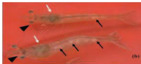
شکل ۱- علائم بالینی در میگوهای آلوده به بیماری ویروسی مرگ پنهان. a: میگوی سالم (مثلث مشکی میگو)

امروزه این بیماری در سایر کشورهای تولید کننده میگو نیز گزارش شده است. Thitamadee و همکاران (۲۰۱۶) شیوع بالایی از بیماری ویروسی مرگ پنهان را در مزارع میگوی تایلند گزارش نمودند همچنین نتایج مشابهی توسط Pooljun و همکاران (۲۰۱۶) با روش تشخیصی RT-nPCR (شیوع ۳۰/۴ درصد) و با روش RT-qPCR (شیوع ۳۷/۷ درصد) گزارش شد. اخیراً برخی از نمونه‌های میگوی سفید غربی جمع آوری شده از ویتنام و اکوادور که توسط روش RT-LAMP ۱۲ مورد بررسی قرار گرفته بودند از لحاظ بیماری ویروسی مرگ پنهان مثبت گزارش شد (Zhang et al., 2017a). بنابراین شیوع بالا و انتشار وسیع از بیماری ویروسی مرگ پنهان در کشورهای جنوب شرق آسیا و آمریکای لاتین نشان می‌دهد که خطر انتقال بیماری از یک منطقه به منطقه دیگر وجود دارد (Thitamadee et al., 2016).