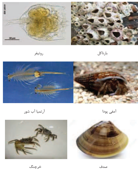
شکل ۴- بی مهره گان موجود در استخرهای پرورش میگو حامل ویروس بیماری مرگ پنهان

حاملین و مخازن ویروس بیماری مرگ پنهان تا کنون پیشگیری و کنترل بیماری مؤثری از بیماری در مزارع پرورش میگو صورت نگرفته است. با این وجود بررسی های به عمل آمده مشخص نموده است که از میان ۱۵ گونه بی مهره جمع آوری شده از استخرهای پرورش میگو مبتلا به بیماری ویروسی مرگ پنهان، ۱۱ گونه از لحاظ ویروس این بیماری مثبت بودند. این گونه ها شامل آرتمیا آب شور ۱ ، بارناکل ۲ ، روتیفر ۳ ، آمفی پودا ۴ ، خرچنگ ها ۵ و صدف ۶ می باشد.