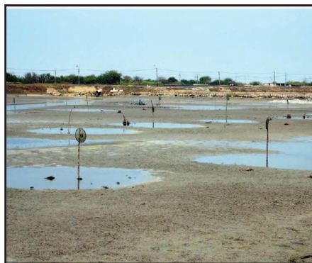
شکل ۵- استفاده از الوار جهت آویختن سینی های غذادهی در استخر پرورش با روش تغذیه کامل در سینی (Ching and Limsuwan, 2012)

اما روش مدیریت تغذیه در اغلب مزارع، توزیع ۹۴ تا ۹۷ درصد از کل غذای روزانه در استخر و قرار دادن تنها ۳ تا ۶ درصد از این میزان در سینی های غذادهی (بسته به سن میگو و روز پرورش) است (تصویر ۶).