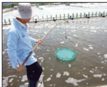
شکل ۳- کنترل سینی غذایی به وسیله چوبدستی قلاب دار (Ziegler and Hooston, 2015)

به کارگیری سینی های غذایی نخستین بار در تایوان (و سپس فیلیپین) به منظور تغذیه میگو در استخرهای واجد بستر آلوده انجام گرفت.