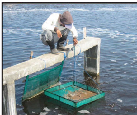
شکل ۶- در اغلب مزارع پرورش، تنها بخش اندکی از غذای تعیین شده در هر وعده، در سینی های غذادهی قرار داده می شود (Thong, 2014)

اما روش مدیریت تغذیه در اغلب مزارع، توزیع ۹۴ تا ۹۷ درصد از کل غذای روزانه در استخر و قرار دادن تنها ۳ تا ۶ درصد از این میزان در سینی های غذادهی (بسته به سن میگو و روز پرورش) است (تصویر ۶).