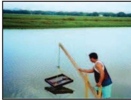
شکل ۴- بررسی سینی غذادهی با استفاده از اهرم ثابت (TNAU, 2016)

منحصراً در سینی ها توزیع می شود. عقیده بر این است که بکارگیری این روش برای تراکم های بیش از ۱۵ قطعه در متر مربع مناسب تر است چرا که در این تراکم اهمیت کنترل غذادهی بسیار بیشتر شده و به دلیل اتکاء صرف میگو به غذای دستی و بواسطه عدم دسترسی به غذای طبیعی در این تراکم لازم است کنترل دقیق تری بر مصرف غذا صورت گیرد تا FCR و رشد به شیوه مطلوبی مدیریت شود (Nunes, 2004).