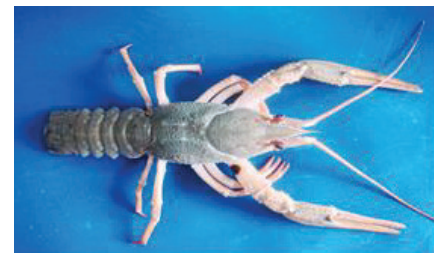
شکل ۲ - نمای پشتی شاه میگوی دراز آب شیرین دریاچه مخزنی ارس A. leptodactylus (Nekuie fard et al., 2011)

۱۳۸۶). اگرچه در خصوص رده بندی زیر گونه A. leptodactylus eichwaldi در بین متخصصین اختلاف نظر وجود دارد (Starobogatov, 1995). در حال حاضر تنها منبع صید و صادرات آن سد مخزنی ارس بوده که از سال ۱۳۷۶ صادرات آن به برخی از کشورهای اروپایی توسط شرکت های خصوصی صورت می گیرد. گرچه میزان صید و صادرات آن در طول سال ها تا به امروز با نوساناتی همراه بوده است. براساس اطلاعات غیر رسمی شاه میگو دراز آب شیرین در منابع آبی ۱۳ استان کشور شامل استان های آذربایجان غربی، شرقی، اردبیل، زنجان، لرستان، فارس، کهگیلویه و بویر احمد، مرکزی، اصفهان، ایلام، خراسان، گلستان و کرمان نیز معرفی شده است (Nekuie Fard et al., 2010).