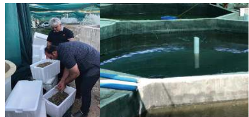
شکل ۱- برداشت میگوها از تانک های پرورشی.

میانگین میزان بازماندگی در زمان فرایند تطابق پذیری در کارگاه تکثیرمکران سالار از شوری ۳۰ به شوری ۱ گرم در لیتر ۷۶/۶٪ بدست آمد. زیست سنجی میگو بوسیله ترازوی دیجیتال با دقت ۰/۱ گرم انجام گرفت و نتایج آخرین زیست سنجی در انتهای دوره (۱۱۱ روزه) و روز برداشت (۲۶ آذرماه ۱۳۹۹) با میانگین وزنی ۱۱/۱۵ گرم بدست آمد (شکل شماره ۲).